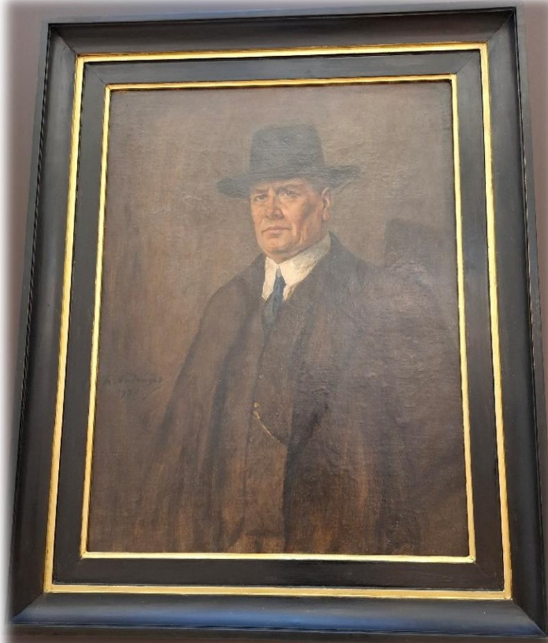
Portrét architekta Blažka (1930) od Františka Ondruška - olej na plátně

Královopolská škola měla ambice stát se nejmohutnější budovou ve městě. Antonín Blažek se zpočátku podílel na výběru nejvhodnějšího projektu v rámci poroty, do které byl přizván. Ač porotci z doručených čtrnácti projektů vybrali čtyři vyhovující, získal nakonec zakázku na definitivní provedení stavby sám Blažek. S rozhodností sobě vlastní ukázal své tvůrčí schopnosti a do pohledově exponované pozice na nově vystavěném Vseslovanském náměstí vložil budovu, ze které vychází pocit sounáležitosti se slovanskými lidovými vrstvami. Přesto je stavba typickou ukázkou monumentální architektury klasicizující moderny v Blažkově osobitěm podání.