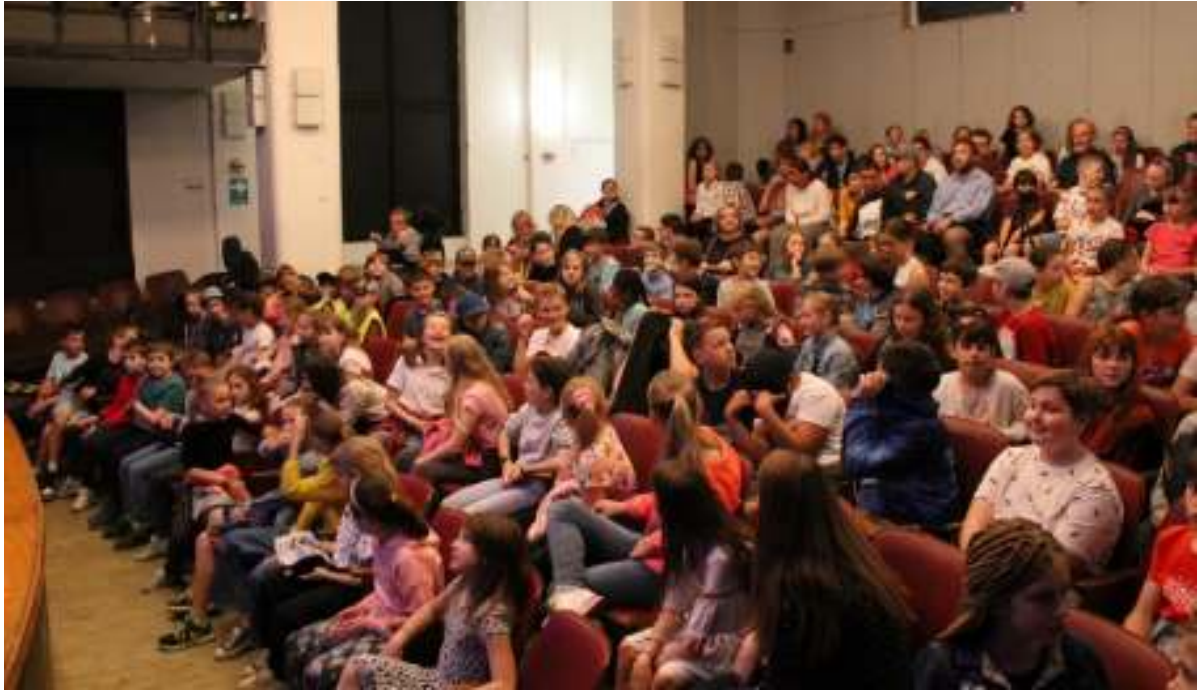
Diváci už sedí v hledišti. Cirkus Kociáno může začít... tramtadadadááááá!!!