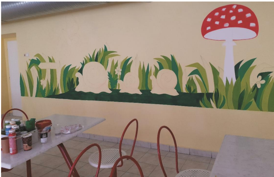
Vymalování školní jídelny

Kompletní rekonstrukce kabinetu ŠPP č. 121 – bourání, sekání, instalace, napojení vody a elektriny, nová podlaha, nový nábytek